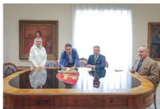
Ascoli Piceno: firmato accordo tra Fondazione Agon Italo-Nipponica e Istituto Suore Pie Operaie Immacolata Concezione di Ascoli Piceno.