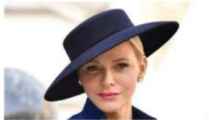
Belasco con la corona: ecco le 15 donne più belle tra i nobili

Ascoli: accordo tra Fondazione Agon Italo-Nipponica e Istituto Suore Pie Operaie a sostegno dell'istruzione dei giovani